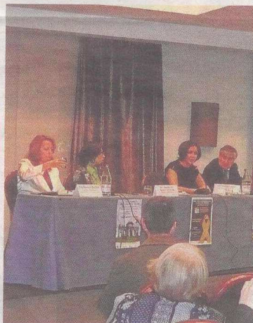
Isabel Gemio participó en los actos conmemorati