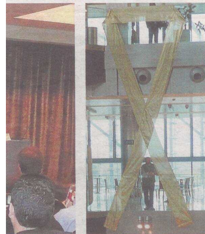
El lazo solidario, de color dorado.

de contar con perros de asistencia. Asimismo, se debatió en torno a los aspectos psicológicos en el proceso de las enfermedades neuromusculares; los temas reproductivos y las técnicas de diagnóstico preimplantacional, muy necesarias en estas patologías de transmisión hereditaria, cuya finalidad es poder tener hijos no afectados por la enfermedad. Los participantes abordaron también temas menos conocidos como son los problemas de sueño, el dolor y su vida sexual.