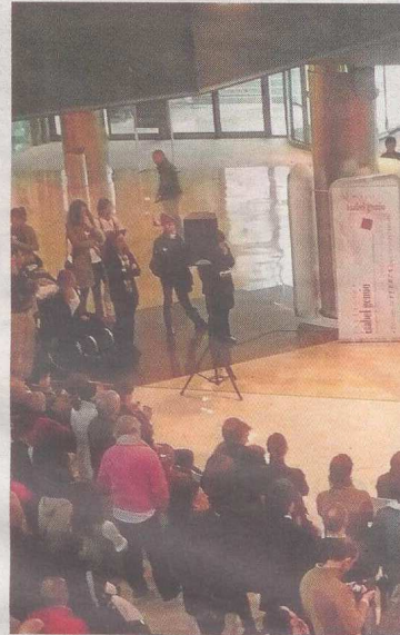
Cientos de personas participaron en la celebración

Asimismo, se analizó la situación social en la que se encuentran las personas que padecen alguna de estas enfermedades en nuestro país. Entre los temas tratados destacan los relacionados con el empleo, las adaptaciones que pueden llevarse a cabo en el hogar para hacer más fácil la vida de estas personas o la posibilidad